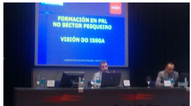
Séance de promotion tenu à Vigo le 26 juin 2017

Chaque partenaire a organisé une séance de présentation de l'outil audiovisuel, du programme de formation et du site web devant un public composé de parties prenantes et de professionnels du secteur, qui bénéficieront de cet outil.