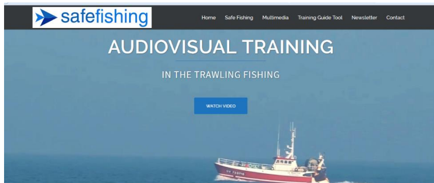
Capture d'écran de la page d'accueil du site

La vidéo est maintenant postée sur www.safefishing.eu où il est possible de la regarder ou de la télécharger dans toutes les langues citées ci-dessus. Il est également possible de regarder ou télécharger une section concernant une activité spécifique de la pêche au chalut.