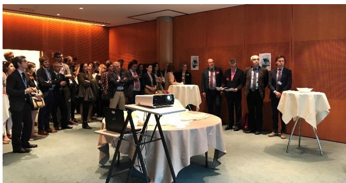
Une partie du public écoutant les orateurs